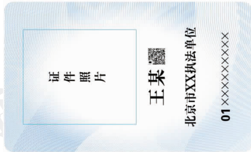
(市级行政执法单位标识卡样式)