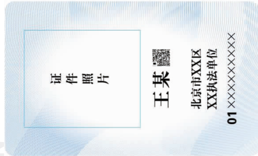
(区级行政执法单位标识卡样式)