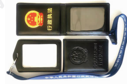
(皮夹、佩戴式卡套、挂绳样式)