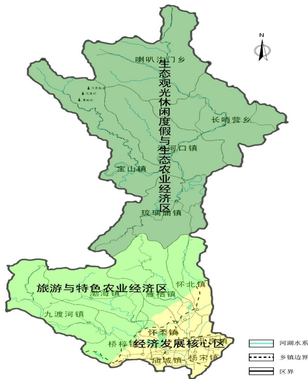
图1 怀柔区产业特色分区

坚持生态涵养的原则，适度开发北部生态观光、休闲度假与生态农业经济区，发展绿色农林牧业、生态观光和休闲旅游，建设水源涵养林自然保护区，适度开发原始森林生态观光旅游，开发建设综合绿色农产品生态产业区。