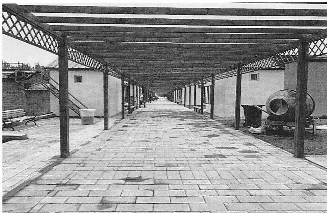
图 1 爬藤廊架