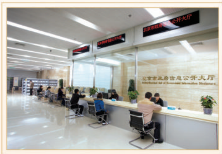
北京市政府信息公开大厅

市政府信息公开大厅累计接待公众咨询查阅2132人次,复印和打印文件5024页。市档案馆政府信息公开查阅中心累计接待公众咨询查阅191人次,复印和打印文件370页。首都图书馆政府信息公开查阅中心累计接待公众咨询查阅1589人次,复印和打印文件3500余页。