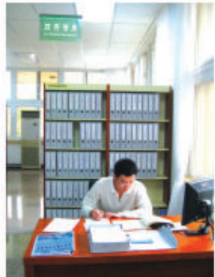
北京市档案馆政府信息公开查阅中心