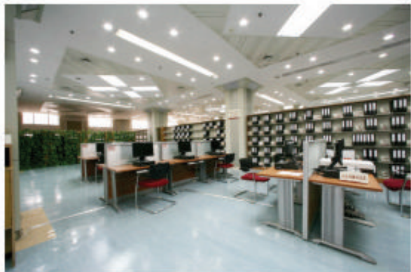
首都图书馆政府信息公开查阅中心