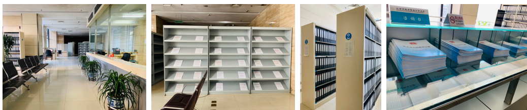
政府信息公开大厅