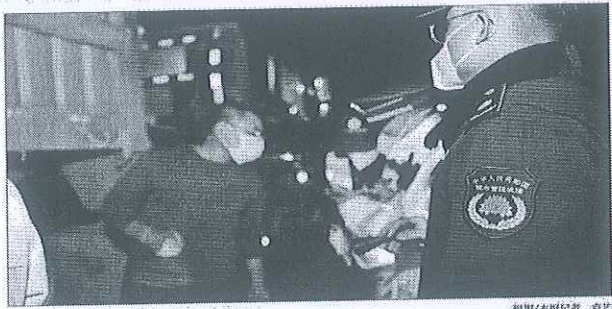
在施工现场,执法人员对违法倾倒垃圾行为进行查处。

执法人员表示,此次查处行动是市城管执法局联合各区城管执法队开展的专项整治行动的一部分。今年以来,已累计查处违法倾倒垃圾行为2.1万余起,追本溯源,有效遏制违法倾倒垃圾行为。