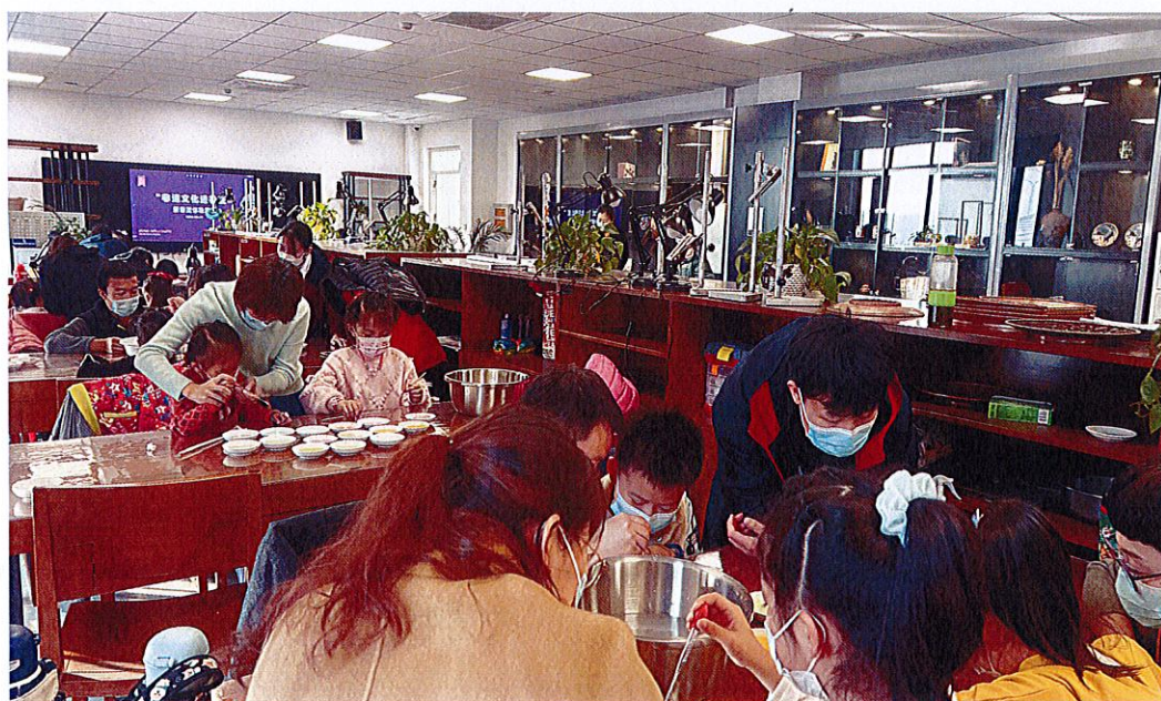
图 2：非遗文化进社区宣传活动