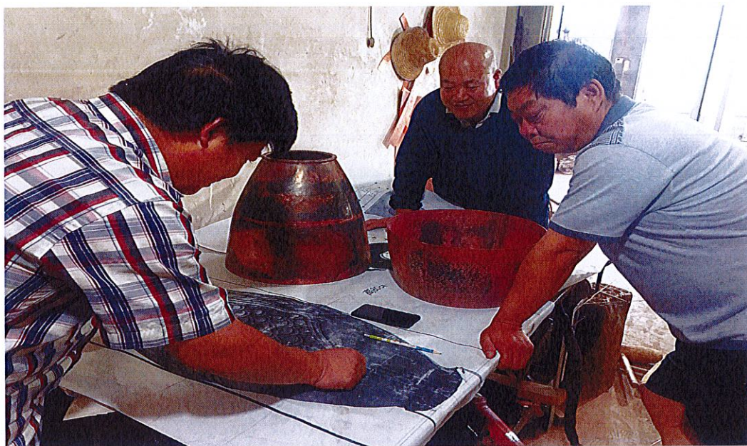
图 3：异形胎体设计、制作过程图