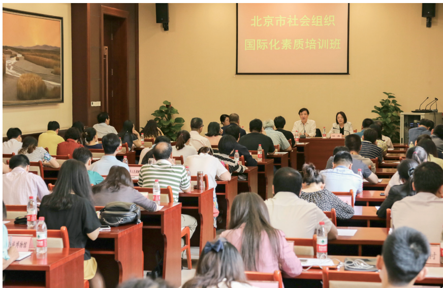
6月1日，北京市首次社会组织国际化素质培训班举办